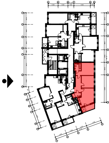
Схема розташування квартири в секції Д*