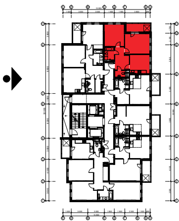
Схема розташування квартири в секції Ж