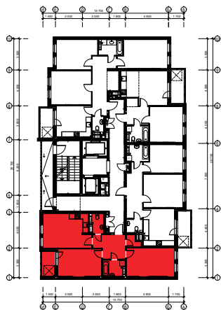
Схема розташування квартири в секції Е