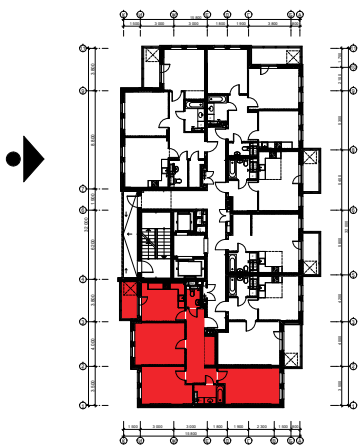
Схема розташування квартири в секції Ж