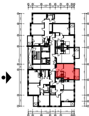
Схема розташування квартири в секції Г