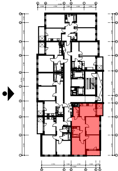
Схема розташування квартири в секції В