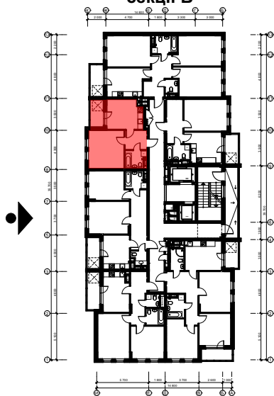
Схема розташування квартири в секції В