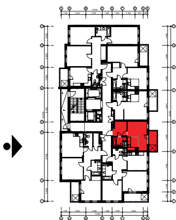
Схема розташування квартири в секції Г