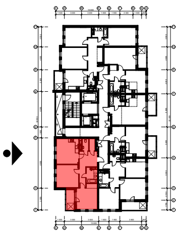
Схема розташування квартири в секції Г